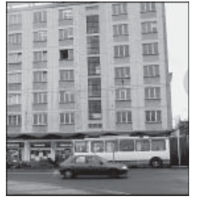
Objekt na Palackého ulici byl řadu let nevyužit. Nyní zde radnice plánuje přestěhování čtyř odborů.