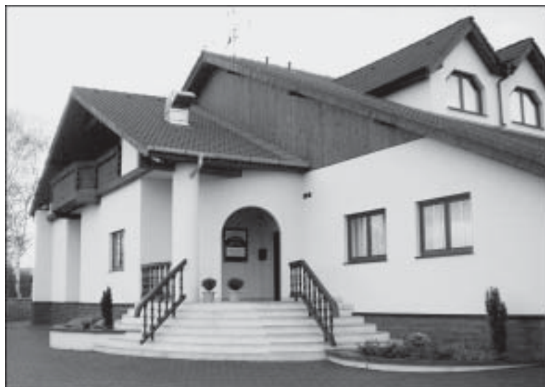
Lipanská ulice láká svou atraktivitou.

Jan Sladký Kozina (†1695), lidový obhájce chodských práv, skutečná postava známá v celých Čechách díky románu Aloise Jiráska. Nebyť právě spisovatelova úsilí, asi by dnes Chodové byli známi snad jen svou svéráznou černou keramikou. Původní název ulice se prozatím nepodařilo zjistit.