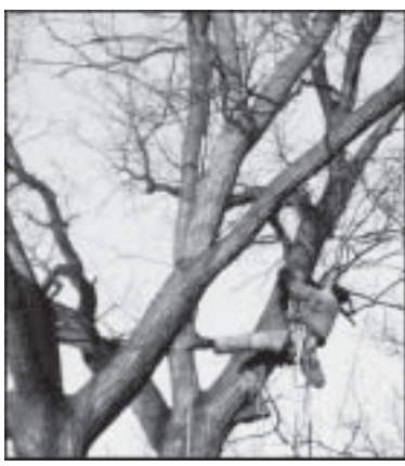
Statný dub v Cihlářské ulici ošetřila ústecká firma Rudolf Müller. (ve)

Chomutovská radnice stejně jako v předchozích letech nechává provést odbornou stromolezeckou firmu průklest větví některých stromů ve městě. Jelikož můžete stromolezce vidět právě v těchto dnech, často se nás občané Chomutova dotazují, kdo vlastně rozhoduje o tom, jaký strom se smí pokácet či prořezat. Stará se o to odbor životního prostředí, který se samo-