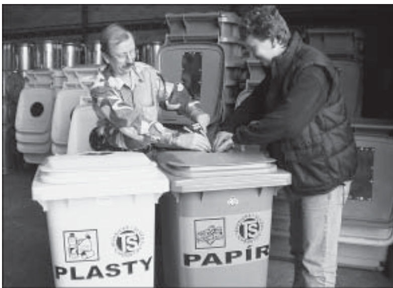
Na podzim loňského roku zaměstnanci Technických služeb města Chomutova rozmístili nádoby na plastové lahve i na zdejší školy.