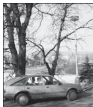
Jak je vidět na snímku z Čelakovského ulice, občas znesnadní prořezávání větvi automobilů, které parkují na nevhodných místech.

stromy například u hřbitova v Beethovenově ulici, odstranit klíněnkou na stromech v centru města a prořezat stromy v městském parku. „Na základě průzkumu mezi občany víme, že si lidé přejí rozmanitou zeleň ve městě. Snažíme se proto tímto směrem uzpůsobit i finanční rozpočty, na druhou stranu nás však mrzí, když lidé například odcíjí nebo zničí vysázené dřeviny před divadlem či na kruhovém objezdu na Palackého ulici,“ povzdechla si Eva Veselá. (mile)