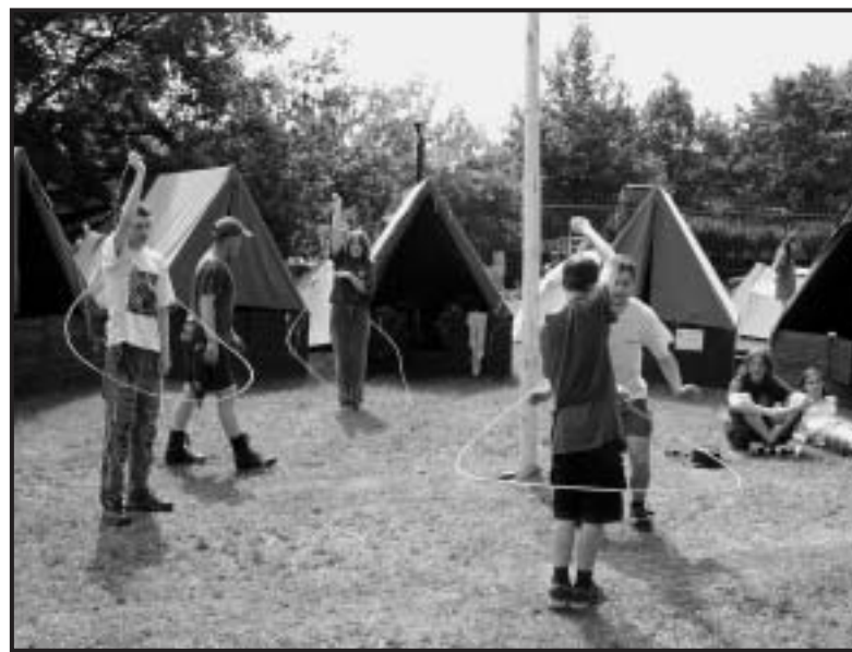
Mnozí se přesvědčili o tom, že ovládat laso není maličkost.

Vše probíhalo v pohodové atmosféře, bez váhání lze akci označit za dětský happening. Ke zdaru značnou měrou přispělo počasí, řada návštěvníků i účinkujících vzala zavděk osvětlením ve vodě jezera. Spokojeni museli být i organizátoři. „Lidé, kteří akci připravují,