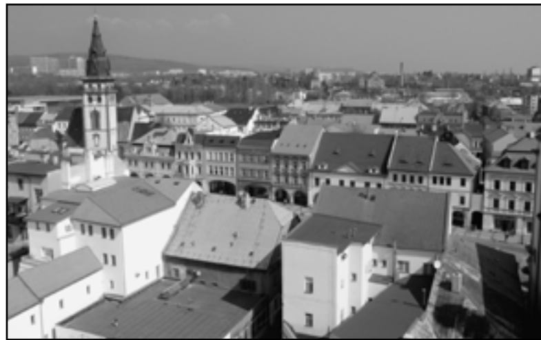
Pohled na město z hvězdářské věže jezuitského areálu.

Předmětem koupě bylo v první řadě město obehnané hradbami a jeho pět předměstí: Mokrá čtvrť s Horním pískem, Vinná ulice, Hřibovské předměstí (nazývané také Boží pole), Dlouhá ulice a Dolní předměstí s Dolním pískem. Kupní cena byla stanovena na 113 715 rýnských zlatých a 46 krejcarů. 26. 1. 1606 byla kupní smlouva vložena do zemských desek. Vykoupením z poddanství získal Chomutov mezi ostatními městy v Čechách zvláštní postavení. Stal se - stejně jako královská města - městem svobodným, které nepodléhalo žádné jiné feudální vrchnosti než českému králi. Mezi královská města, jenž spravoval podkomoří a v každém z nich zastupoval zájmy panovníka královský rychtář, však Chomutov nebyl povýšen. Správu Chomutova převzal úřad tzv. české komory a žádný královský rychtář v Chomutově nikdy nepůsobil. „Oslavy se budou konat po celý nadcházející rok. Všechny kulturní i sportovní akce budou věnovány a směřovány právě k této záležitosti. Pořádány budou nejen Městem Chomutov, ale také organizacemi města, ať je to Podkrušnohorský zoopark, Správa kulturních zařízení, Správa sportovních zařízení a Středisko knihovnických a kulturních služeb. Na oslavách se budou podílet i jiné společenské, kulturní a sportovní organizace ve městě, především Oblastní muzeum Chomutov a soukromá agentura Modua,“ nechala se slyšet vedoucí odboru školství a kultury Dagmar Mikovcová. Právě proto bude většina propagačních materiálů opatřena logem oslav. Ty pak