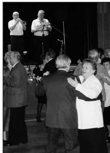
Návštěvníci se rádi zapojí do dění. Seniorský vylákala na parket Malá muzika, děti na pódium zase principál Svátova dividla.

To samé platí i v případě nedělních pohádek pro děti, které se konají jednou měsíčně. V posledních letech se jejich začátek ustálil na 15. hodině, čímž vycházejí vstříc polednímu spánku malých diváků. Přestože to v dnešní době není příliš obvyklé, udržuje SKZ lidové vstupné 30 korun. Stejně tak na Zahradní probíhají i dopolední po-