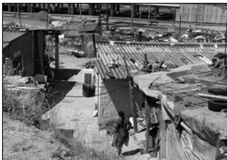
Přestože Španěle začleňují Romy do společnosti 35 let, malá část jich ještě žije v příměstských slumech.

Systém, který vychází z 35letých zkušeností, by chomutovský místostarosta uvítal i v ČR: „Je třeba vyvíjet tlak na legislativu, aby umožnila vznik ministerstvy zastřešovaných agentur nebo neziskových organizací, které by měly za úkol vytvořit síť pracovníků pro denní styk se sociálně slabými