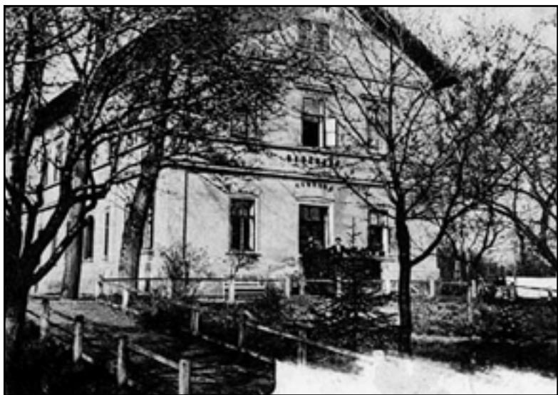
Na snímku tehdejší lázeňský dům, dnes je tu správní budova PZOO.

Článek v minulém čísle Chomutovských novin s názvem „Je ideální výstaviště nebo lázeňská klinika“ o architektonických úvahách, jak by měla v budoucnu vypadat lokalita Vinohradských kasáren v Chomutově, zaujal řadu našich čtenářů. Mnozí z nich nám telefonovali a vypyтали se na kamencové lázně, které kdysi stávaly v místech dnešní správní budovy Podkrušnohorského zooparku. Proto jsme se rozhodli některé zajímavé informace uveřejnit spolu s fotografií v našich novinách.